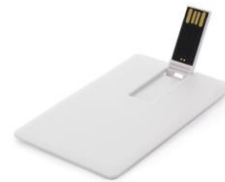
Abbildung eines "USB-Stick Photocard Slim (1GB)"